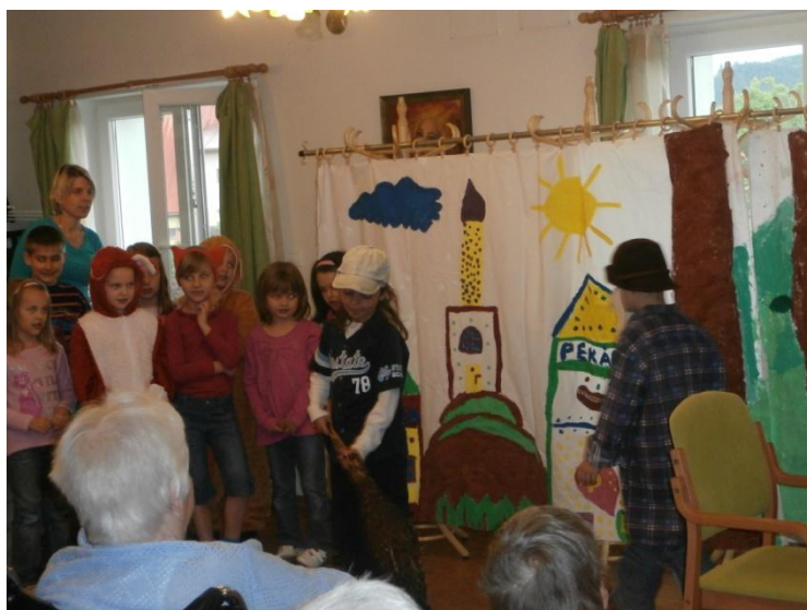
Vystoupení dětí v Domově Jabloňová