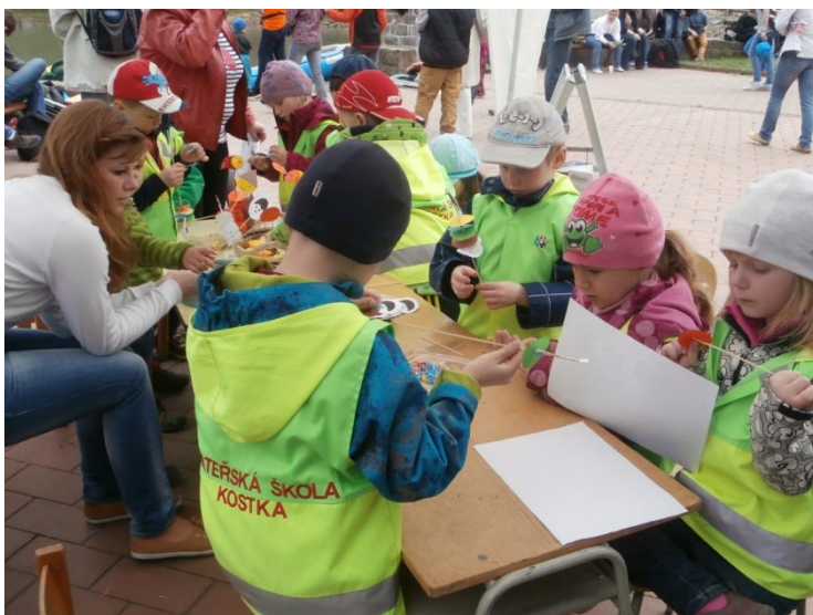
Den země 2013